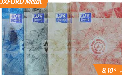
Agenda OXFORD Métal

Et, pour avoir la classe, les collégiens et lycéens adopteront l'une des deux nouveautés de la rentrée : l'agenda journalier OXFORD Métal , avec sa couverture souple, son décor imprimé sur une base en polyester argent et un pelliculage brillant, ou alors le très design 10DENCE , avec sa couverture rembourrée rigide, son dos toilé et son pelliculage mat.